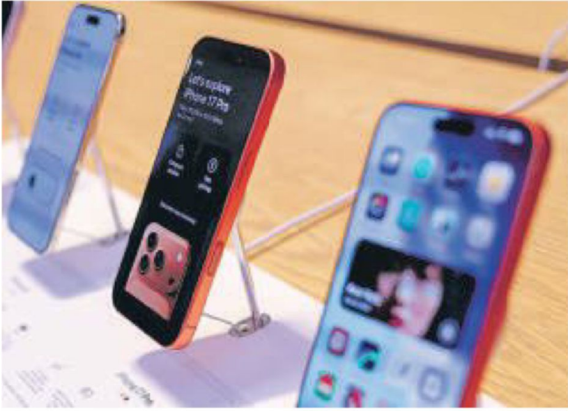
Projections from three analysts collated by Mint show that Apple sold 15.5 million iPhones in India in calendar 2025.

Apple's best-ever quarter comes as it begins its count-down to 50 years of existence, with a global revenue of $143.8 billion. While it does not call out nation-wise product sales or revenue figures, projections from three analysts collated by Mint show Apple sold 15.5 million iPhones in India in 2025, ending the year with $10 billion in revenue. "We did set a quarterly revenue record during December. And to go a little further down, we set quarterly revenue records on iPhone and Mac and iPad, and